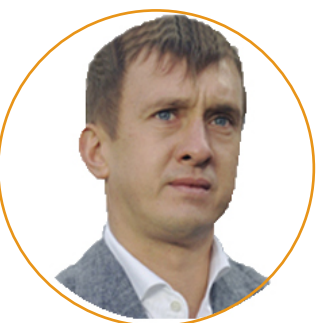
Александр Алаев, Генеральный директор РФС