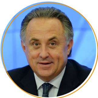
Виталий Мутко, заместитель Председателя Правительства РФ, президент РФС

В предыдущих выставках принимали участие сотни компаний более чем из 30 стран . Участниками и гостями конференции в разные годы стали: