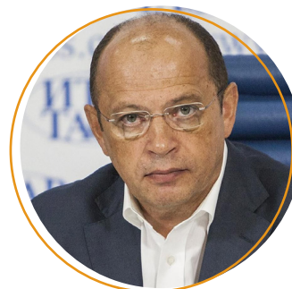
Сергей Прядкин, президент РФПЛ