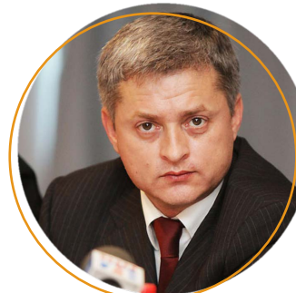
Игорь Ефремов, президент ФНЛ