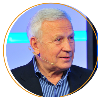
Вячеслав Колосков, почётный президент РФС и почётный член ФИФА