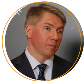
Алексей Сорокин, глава оргкомитета «Россия-2018»