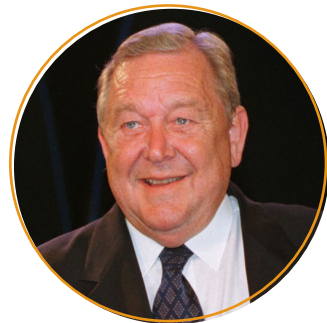
Леннарт Юханссон, футбольный менеджер, президент УЕФА в 1990—2007 годах