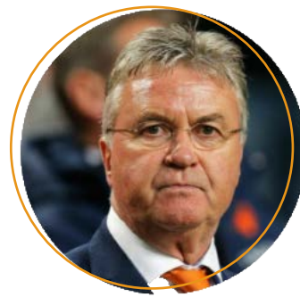
Гус Хиддинк, экс-тренер национальной сборной России по футболу